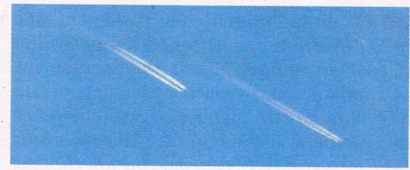
Foto 1: Normale Kondensstreifen (Contrails) lösen sich i.d.R. innerhalb von Sekunden bis zu Minuten auf.

Ca. 100 Regenwasserproben aus Deutschland bestätigten auch erhöhte Werte von Aluminium, Barium und Strontium.