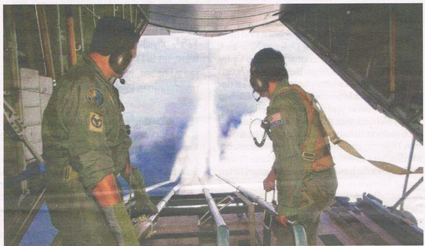
Sprühvorrichtungen sind schon lange für verschiedenen Zwecke im Einsatz

Seit einigen Jahren wird das sog. «GEOENGINEERING» als Heilmittel für die auch bei Wissenschaftlern sehr umstrittene menschengemachte Klimaerwärmung propagiert, wozu u.a. auch Aerosolversprühungen durch Flugzeuge gehören, welche einen Teil der Sonnenstrahlung zwecks Abkühlung ins Weltall zurück reflektieren sollen. Normale Kondensstreifen können sich erst ab Flughöhen über 7500 m, mindestens