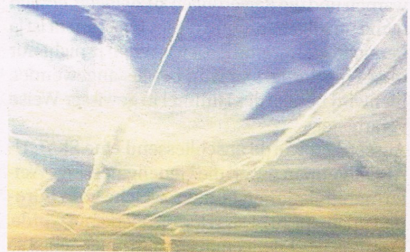
Foto 3: ...bis sie durch Zusammenfliessen den ganzen Himmel mit einer künstlichen weissen Schicht bedecken.