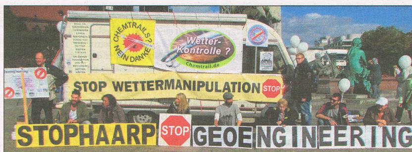
Am 23.4.2016 findet in Berlin wieder eine Demo, der «Global March Against Geoengineering & Chemtrails» statt.

Unter dem Begriff Climate Engineering (CE) werden gezielte Eingriffe in das Klimasystem zur Minderung der Erderwärmung zusammengefasst. Der Begriff Geo-Engineering umfasst neben CE-Technologien weitere Methoden, die darauf abzielen, dem atmosphärischen Kohlen-